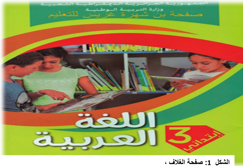
الشكل 1: صفحة الغلاف ، المصدر كتاب السنة الثالثة ابتدائي ، بن الصيد بورني سلاب واخرون ، الجزائر 2022

يعد الغلاف من العناصر الهامة و الاساسية للكتاب لما يحمله من رموز و قيم جمالية مدروسة تتلائم مع مضمونه فيشكل بذلك العتبة البصرية للنص المقروء و نقطة عبور نحوى المتلقي بما يحتويه من الوان و صوره و اشكال والتي تختار بعناية فيعطي فكرة عامة عما يروج بداخله و يثير دافعية المتلقي و يحفز رغبته في الاطلاع على محتواه .