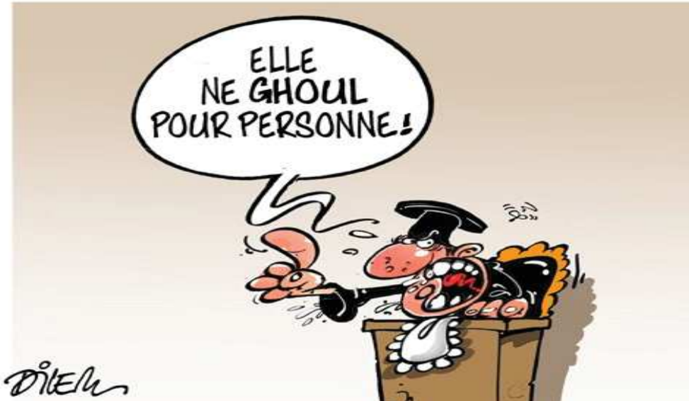
Caricature : 02