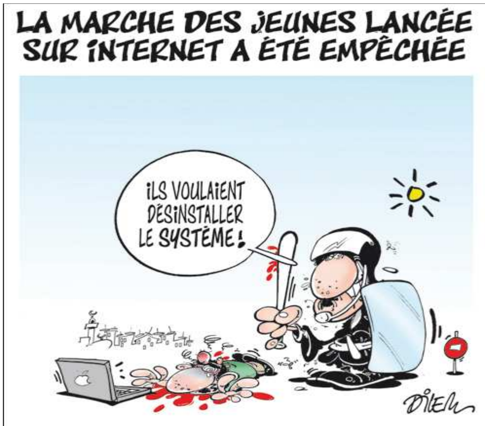
Caricature : 10