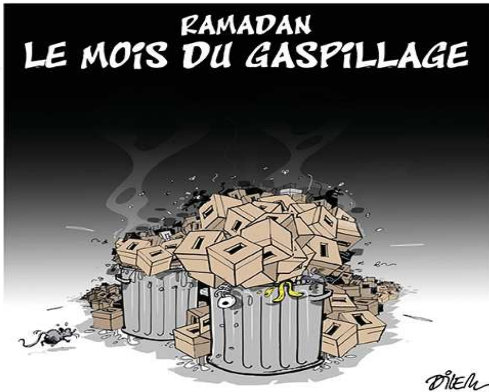
Caricature : 08