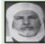
محمد العيد آل خليفة

ديوان محمد العيد - دار الهدى - عين مليلة- الجزائر 2010