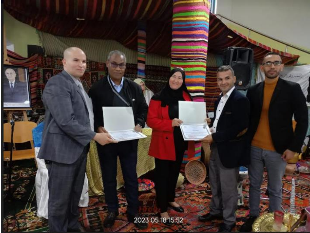
صورة توضح: تكريمات خلال فعاليات اختتام شهر التراث