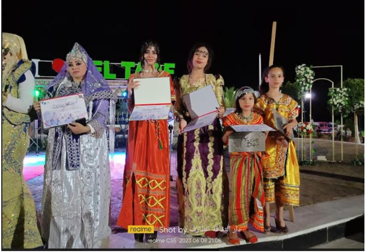
صورة: توضح اللباس التقليدي لبعض الولايات