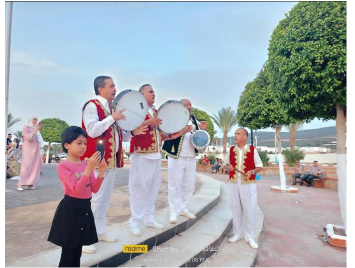
صور توضح: الحفلات