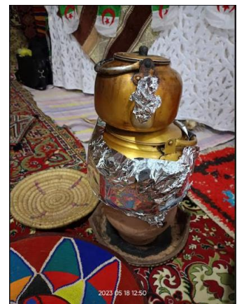
صور توضح: مسابقة للأكلات التقليدية