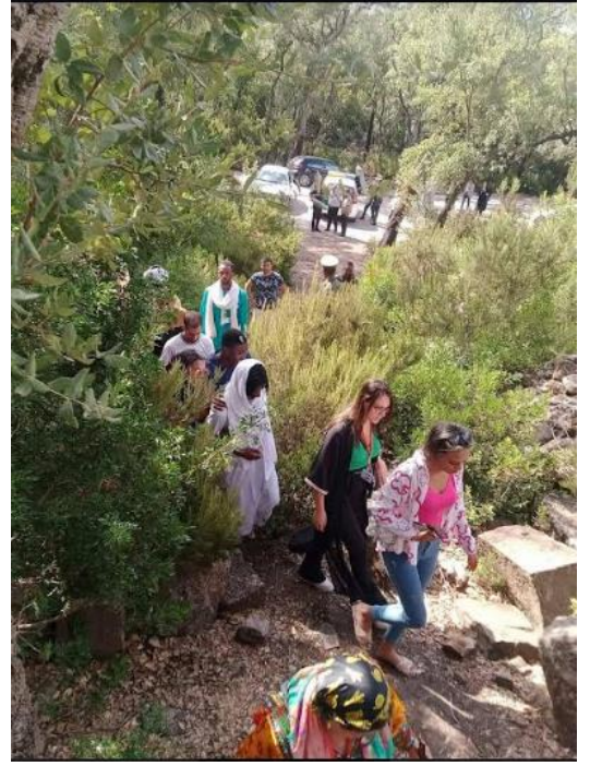
صورة توضح جولة سياحية واستكشافية للمواقع الاثرية لبلدية العيون ولاية الطارف