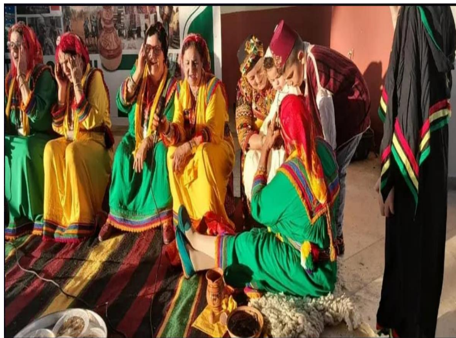
صور: توضح اللباس التقليدي لولاية تيزي وزو