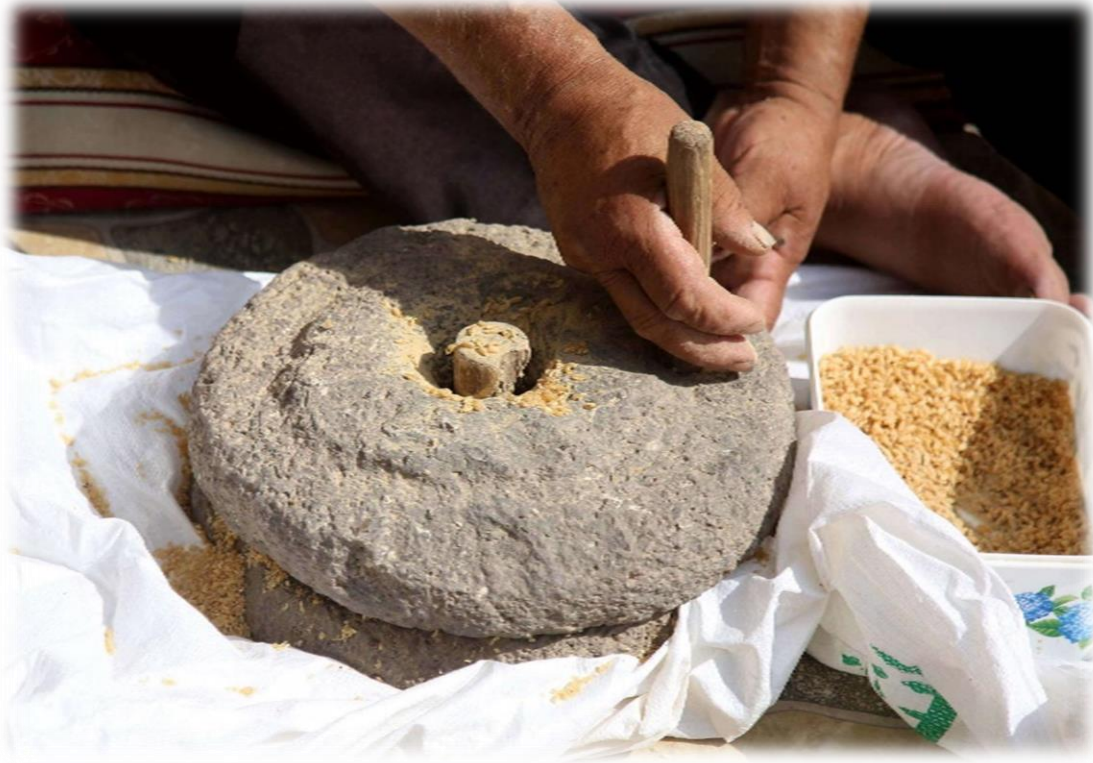
الوثيقة 10: الألة المستعملة في عملية الرحي القمح والشعير