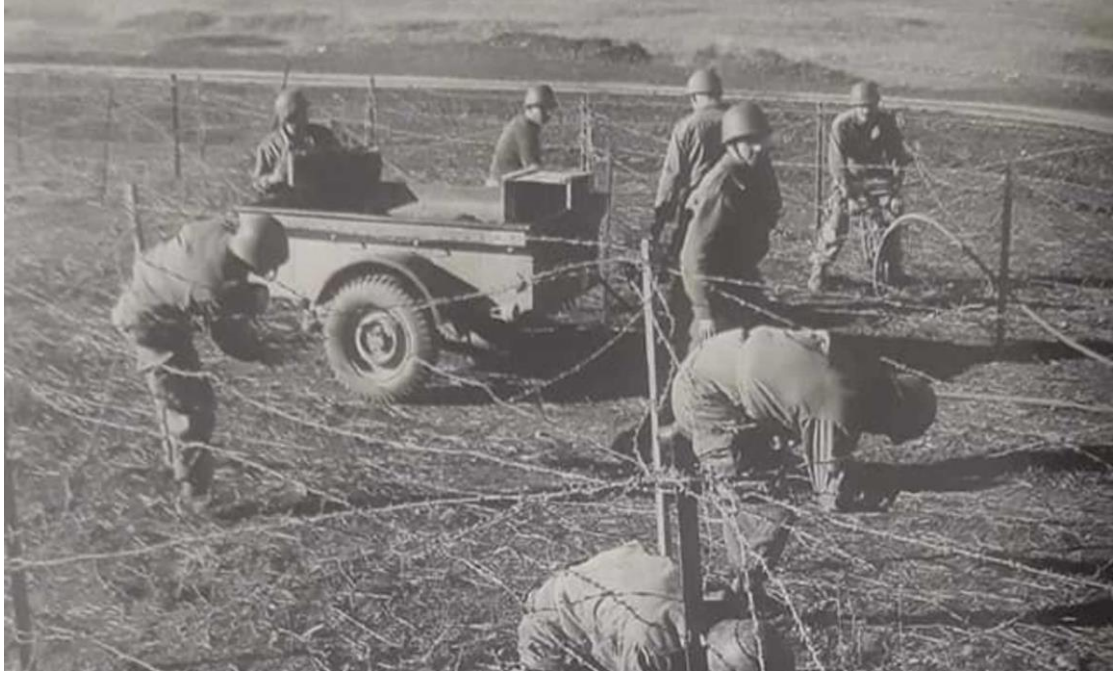
الوثيقة 04: خطي شال وموريس