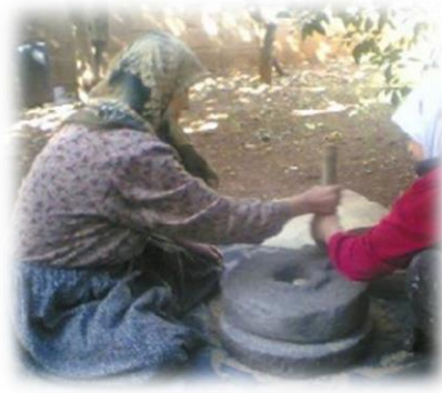
الوثيقة 09: مجموعة من النسوة يقمن بعملية الرحي