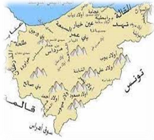
الوثيقة 01: خريطة منطقة الطارف