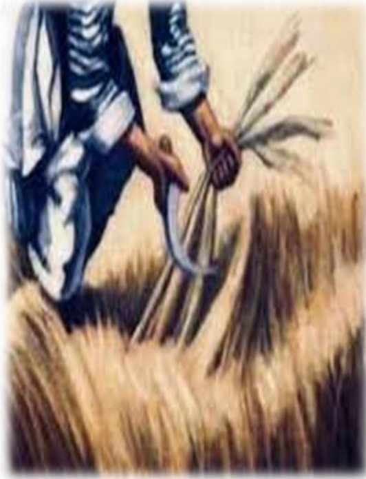
الوثيقة 07: المنجل