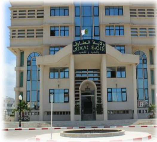
الوثيقة 02: ولاية الطارف