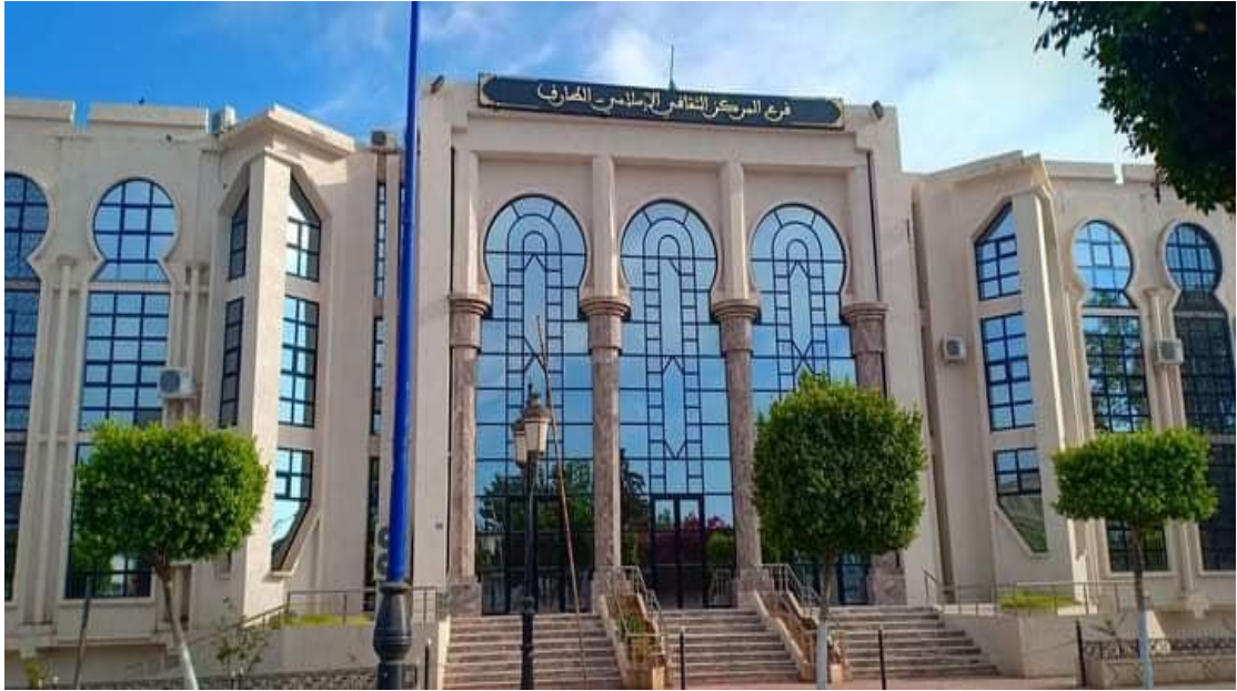
الوثيقة 05: المركز الثقافي الإسلامي بولاية الطارف