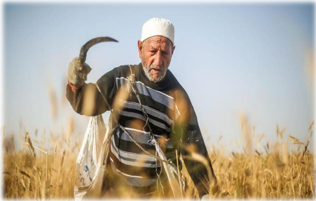
الوثيقة 08: شيخ يستخدم المنجل في عملية الحصاد