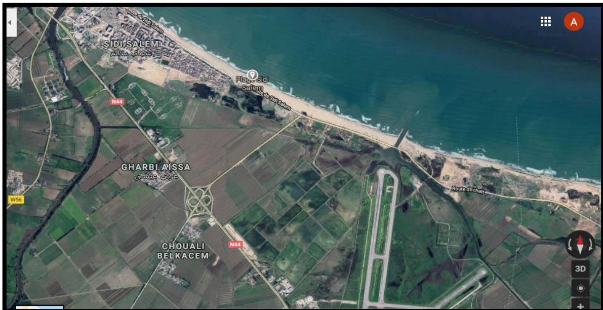
photo n°01 : Localisation de station d'étude sur la carte satellite.

Sidi Salem est une cité côtière de la wilaya d'Annaba (latitude 36°,30 N et 37°,03 N et 7°,20 E et 8°,40 E), ouverte sur le littoral méditerranéen sur 80 km, elle s'étend sur 1412km 2 , elle a une superficie de 1.5km 2 , et une population de 70 000 habitants. Elle reçoit par le biais des Oueds Seybouse et Mefrague de l'eau issue des bassin versant de la région, et des déchets urbains, en plus des rejets de la zone industrielle ASMIDAL spécialisée dans la production de fertilisants et de produits phytosanitaires (oued Seybouse).