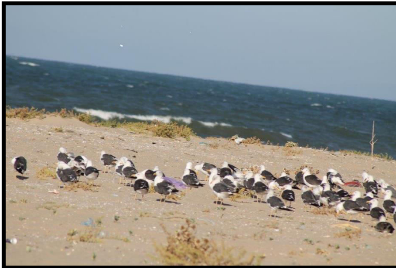
Photo n° 06- Contingent de Goéland brun au niveau de la plage de Sidi Salem (Annaba)

• Le Goéland brun, Larus fuscus , est un hivernant régulier au niveau des plages de Sidi Salem et de la Mefragh (Photo 24). Les observations de cette espèce peuvent se faire à partir de la fin du mois d’Août, on peut dénombrer jusqu’à 200 individus entre adultes et immatures au cours de son hivernage au niveau des plages de Annaba.