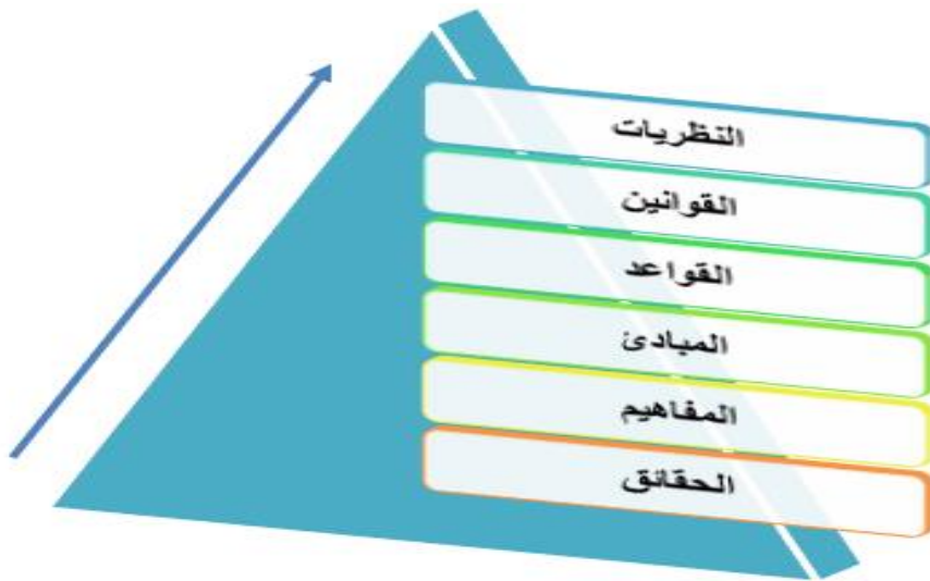
الشكل رقم ( 01 ) يوضح مكونات البنية المعرفية (2)

حيث وضع مخططاً للبنية المعرفية التي يتألف منها المحتوى و تقدمها في الشكل الآتي :