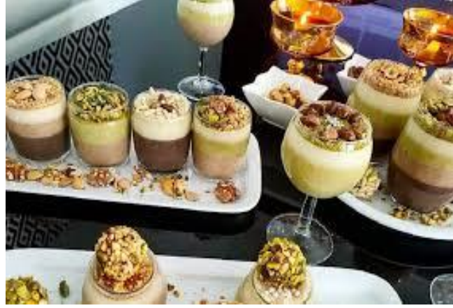
طبق الزقوقو الشهير

الرسول لفرق المولدية الأسواق العتيقة وتضفي على المدينة قدسية خاصة وتتكفل العائلات الميسورة بختان أبناء العائلات المعوزة 1 .