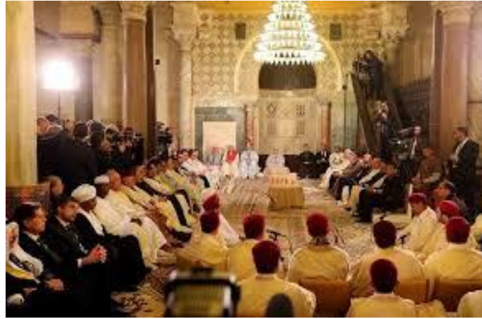
بالتهليل والتسبيح إله عليه وسلّم