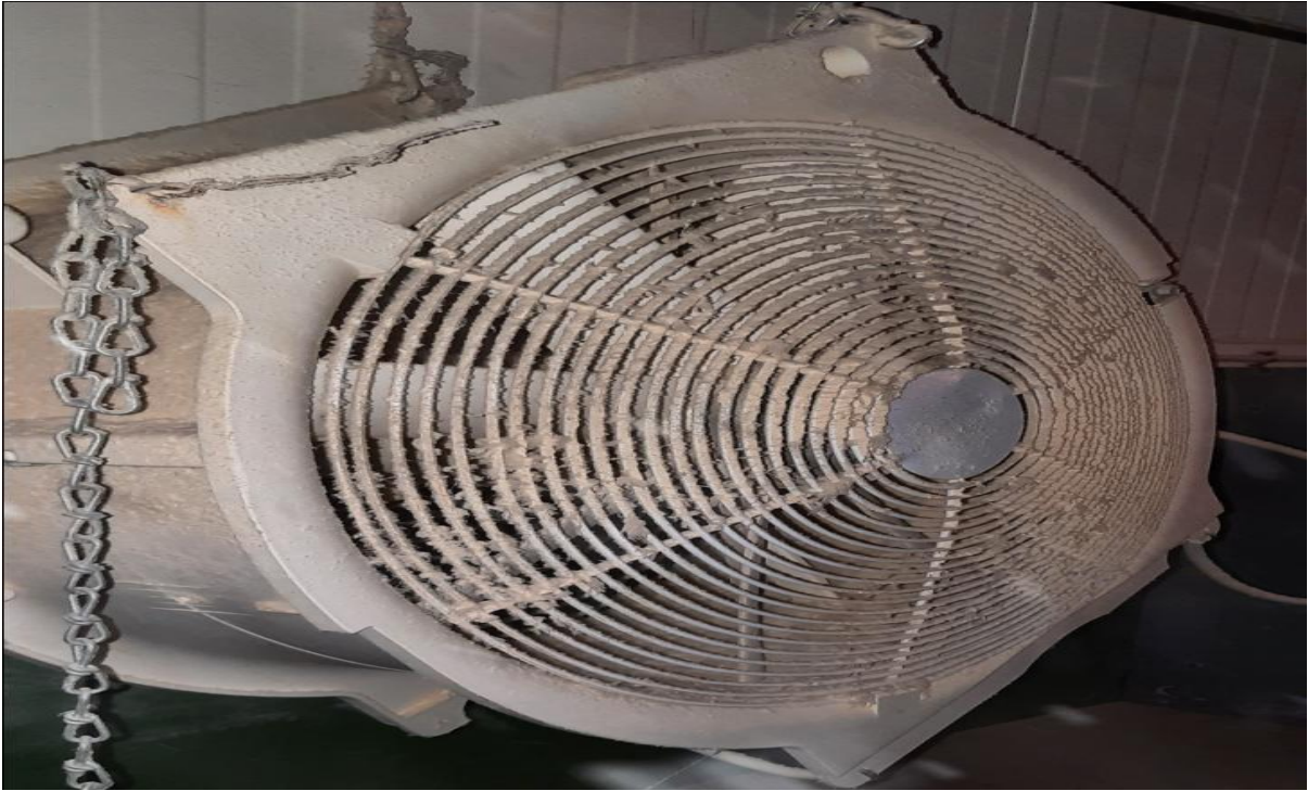
Figure 16 : Les ventilateurs