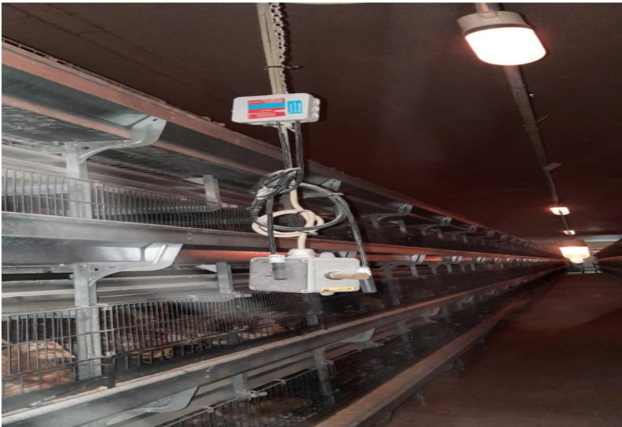
Figure 11 : Indicateur de température (thermomètre)