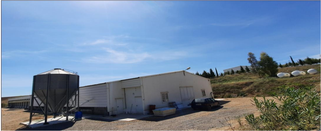
Figure 4: Vue extérieure du bâtiment.