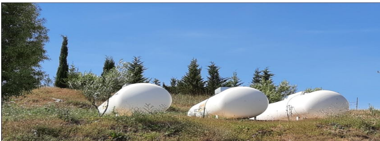
Figure 9 : Les citernes de gaz à propane