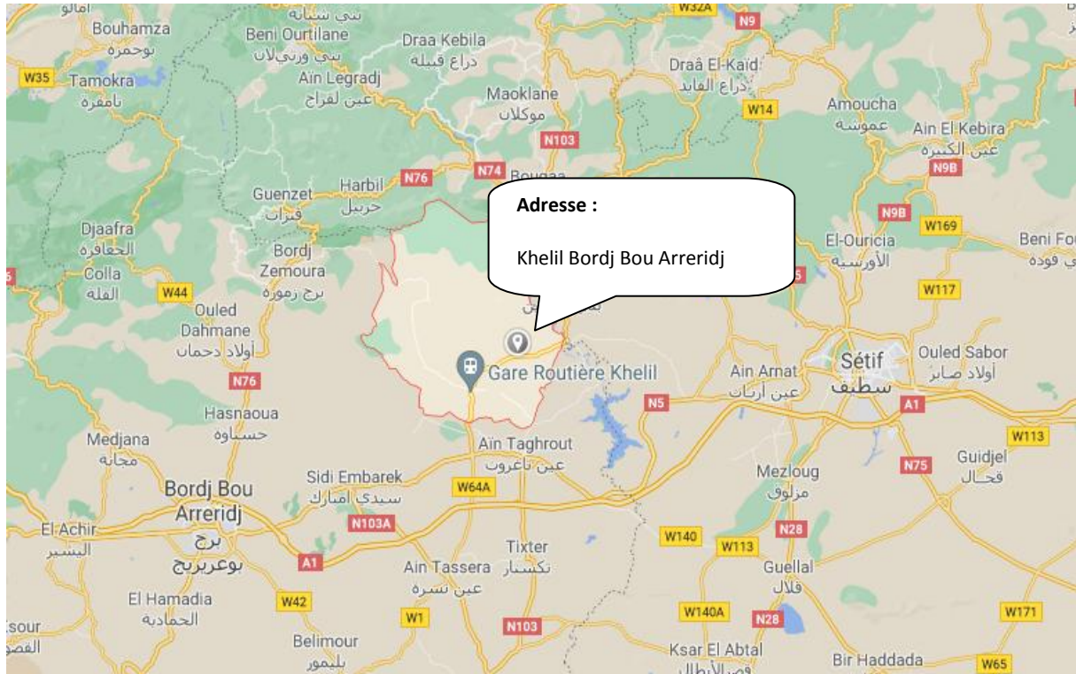
Figure 3: Localisation de la région d'étude.

Nous avons effectués notre travail dans la région Khelil, wilaya de Bordj Bou Arreridj. Elle se caractérise par un nombre important d'élevage de 65000.