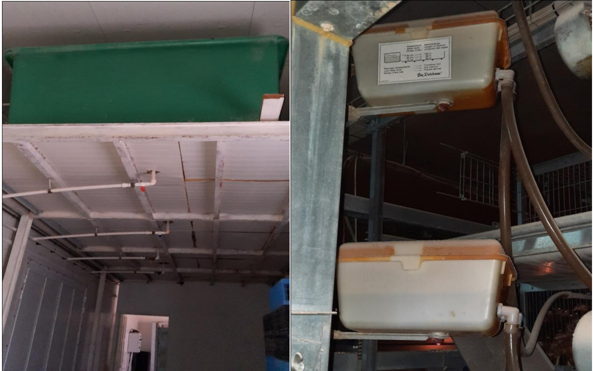
Figure 17 : Les bacs à eau