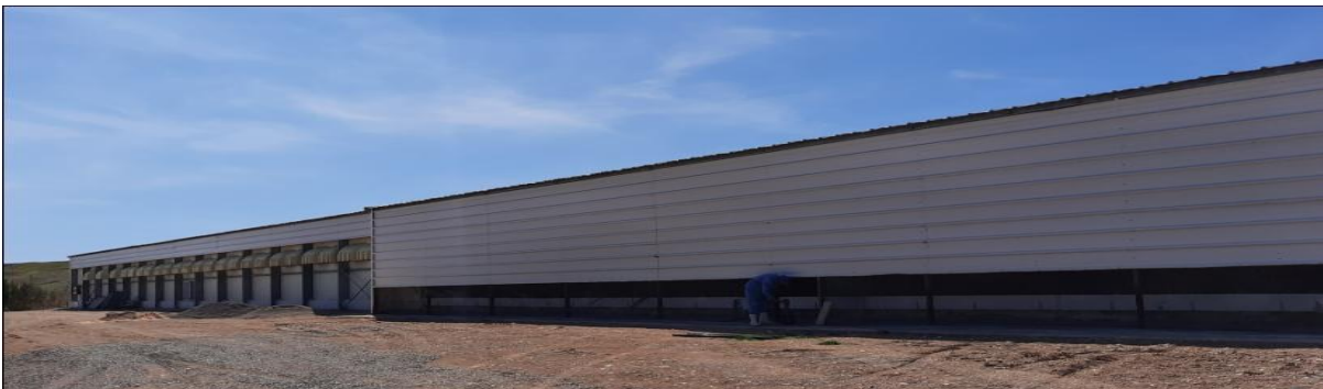
Figure 15 : Pad Cooling