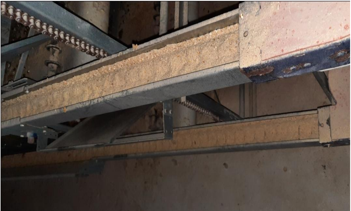
Figure 19 : Système de distribution par chaîne