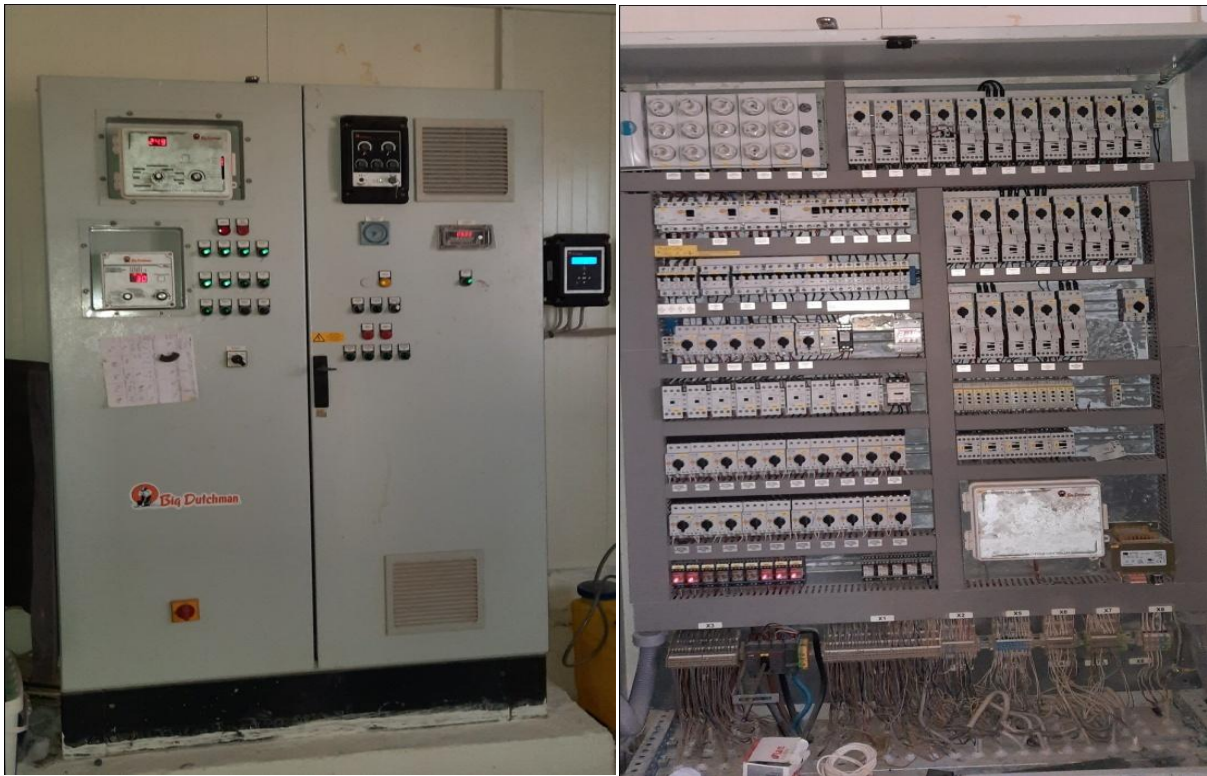
Figure 23 : Armoire de distribution