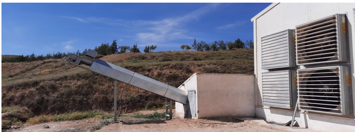
Figure 22 : Système de sortir des fientes