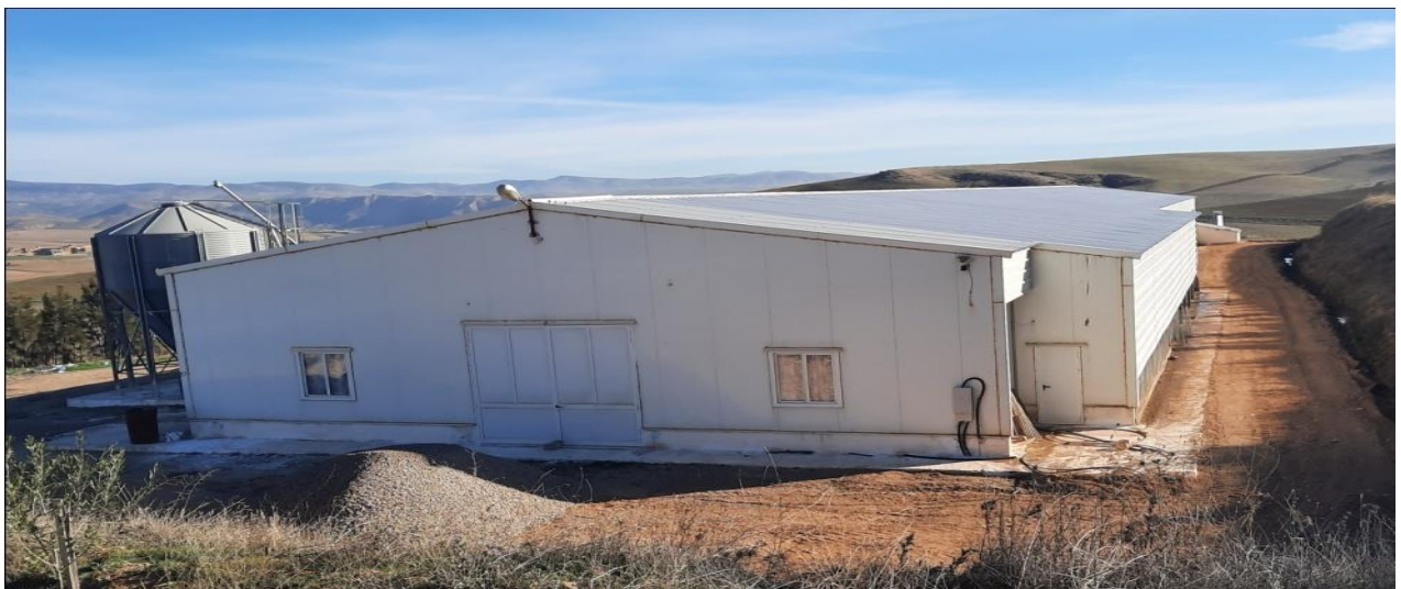
Figure 7: Bâtiment d'élevage.

On trouve un bâtiment d'une longueur de 70mètre, d'une largeur de 16mètre et d'une hauteur de 4,5mètre. Il a la capacité de 65000 poulettes démarrées. Il contient six (06) batteries de quatre (04) étages. Ces batteries ont une longueur de 60mètreet une largeur de 1,5mètre.