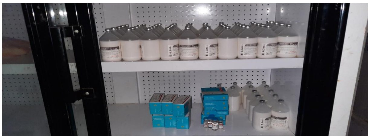
Figure 25 : Stockage de vaccin