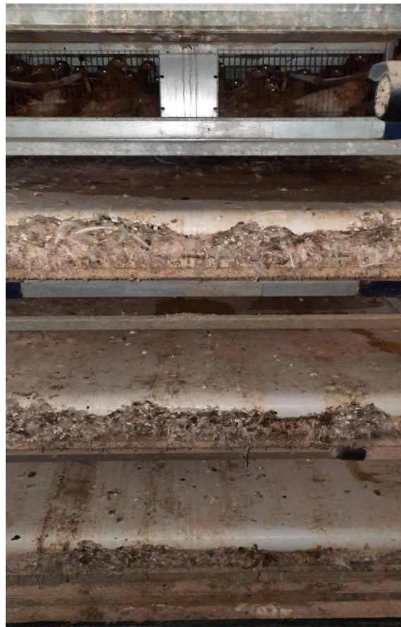
Figure 21: Tapi roulon d'éjection des fiente

Assuré par un tapi roulant pour chaque étage.