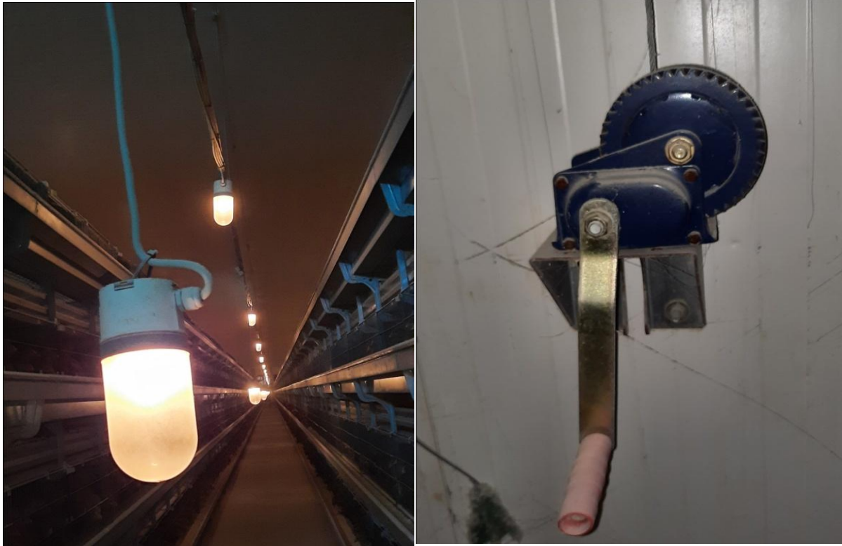
Figure 12 : La distribution de lampe d'éclairage et le régulateur de la hauteur

Au cours de l'élevage, l'intensité lumineuse tend à diminuer avec l'âge des poulettes.