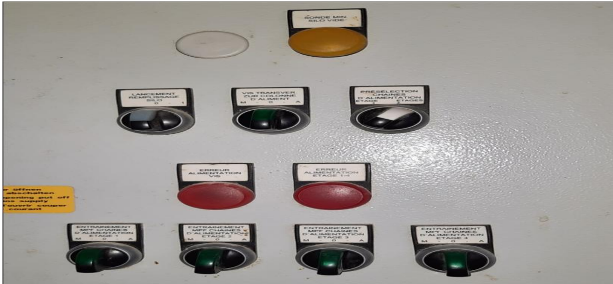
Figure 20 : Les paramètres de réglage alimentaire