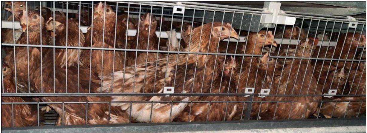
Figure 6 : Photo de poulettes démarrées à l'âge de 14 semaines.