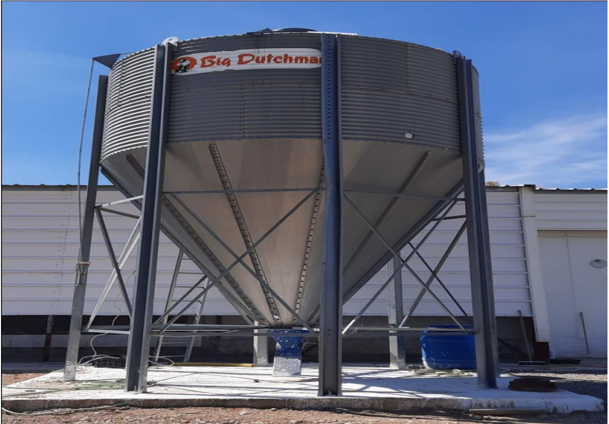
Figure 18 : Silo d'alimentation