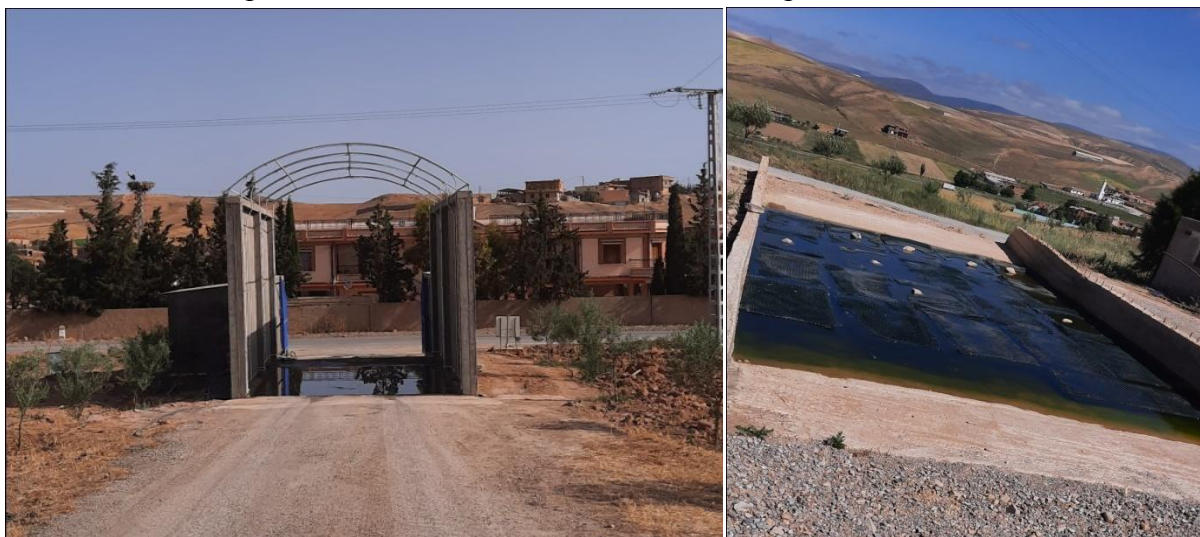
Figure 24 :L'autoclave

Cette barrière sanitaire se prolonge pendant toute la période d'élevage ( 18 semaines ).