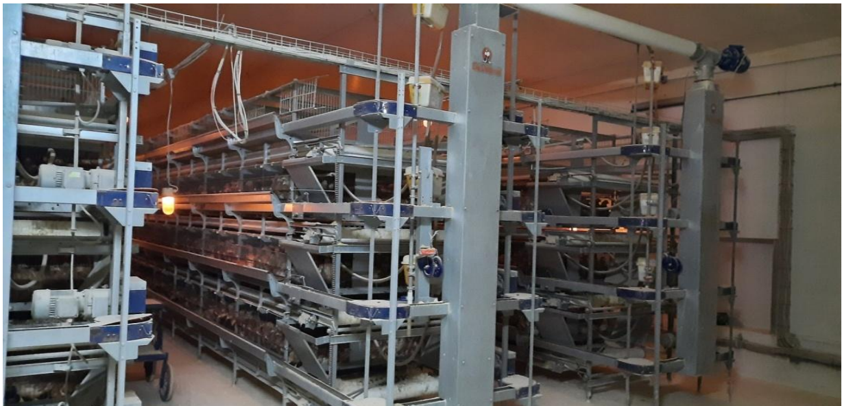
Figure 5: Vue intérieur du bâtiment.