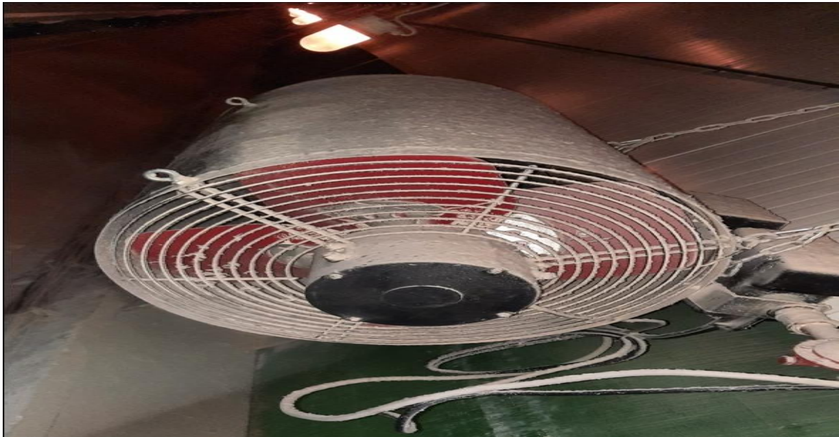
Figure 8: La chaudière