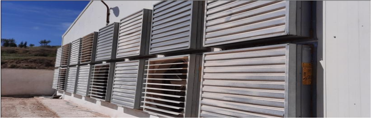
Figure 13 : Les extracteurs de l'air