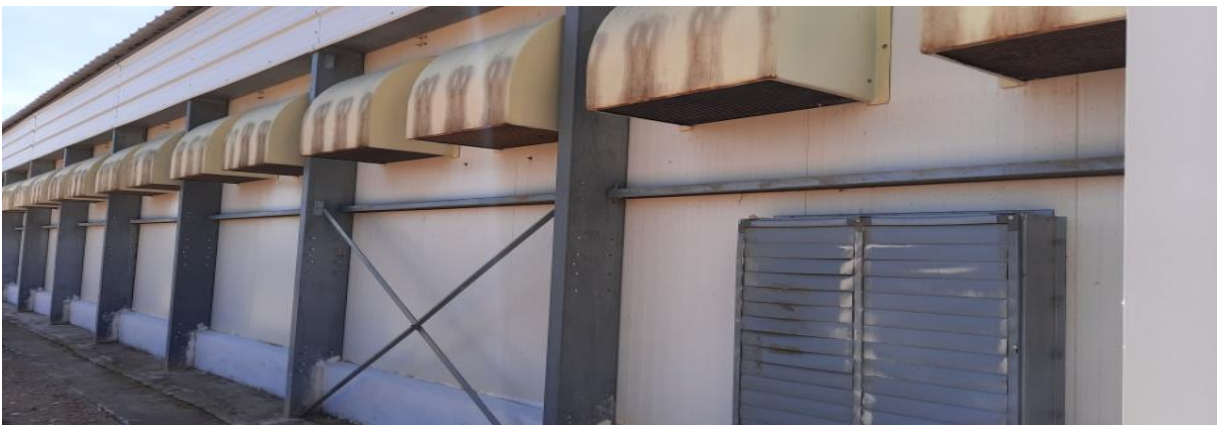
Figure 14 : Les fenêtres.