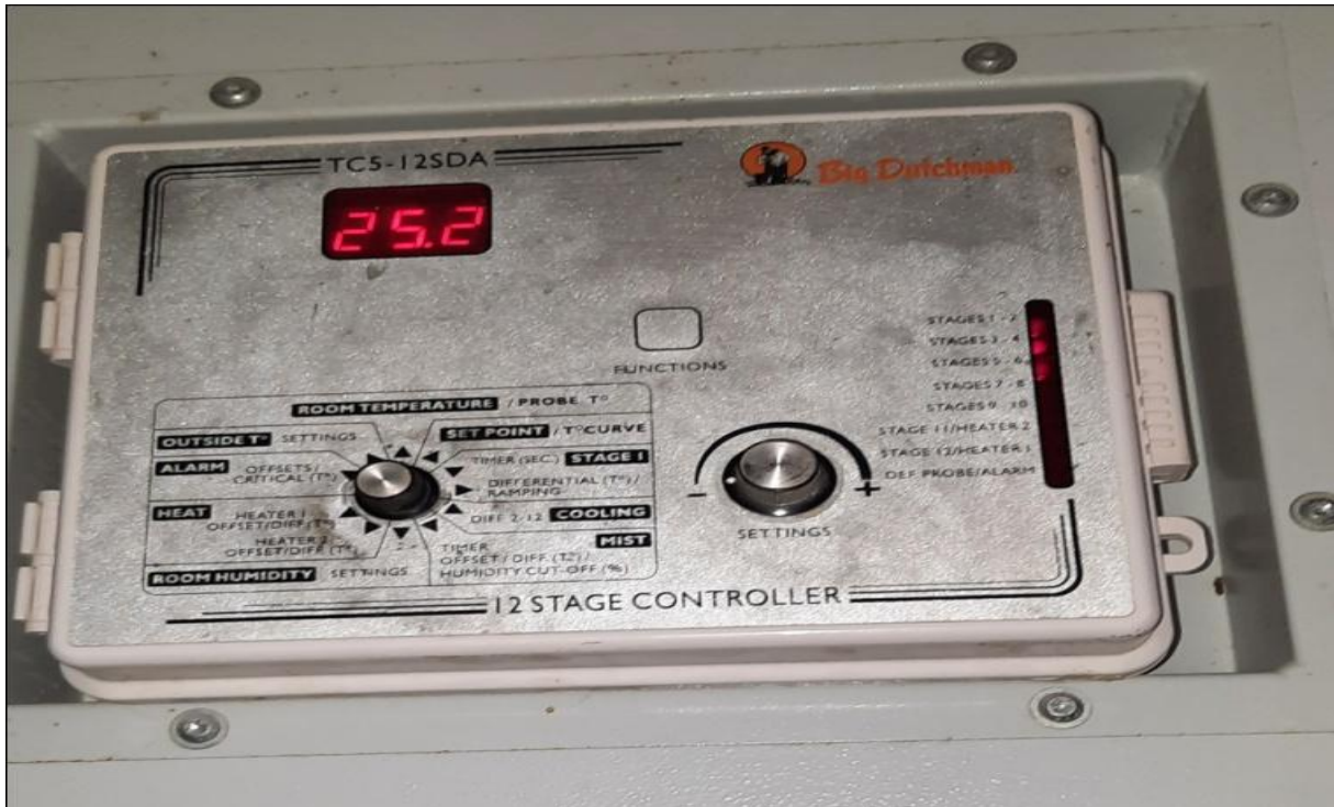
Figure 10 : Régulateur thermostatique.