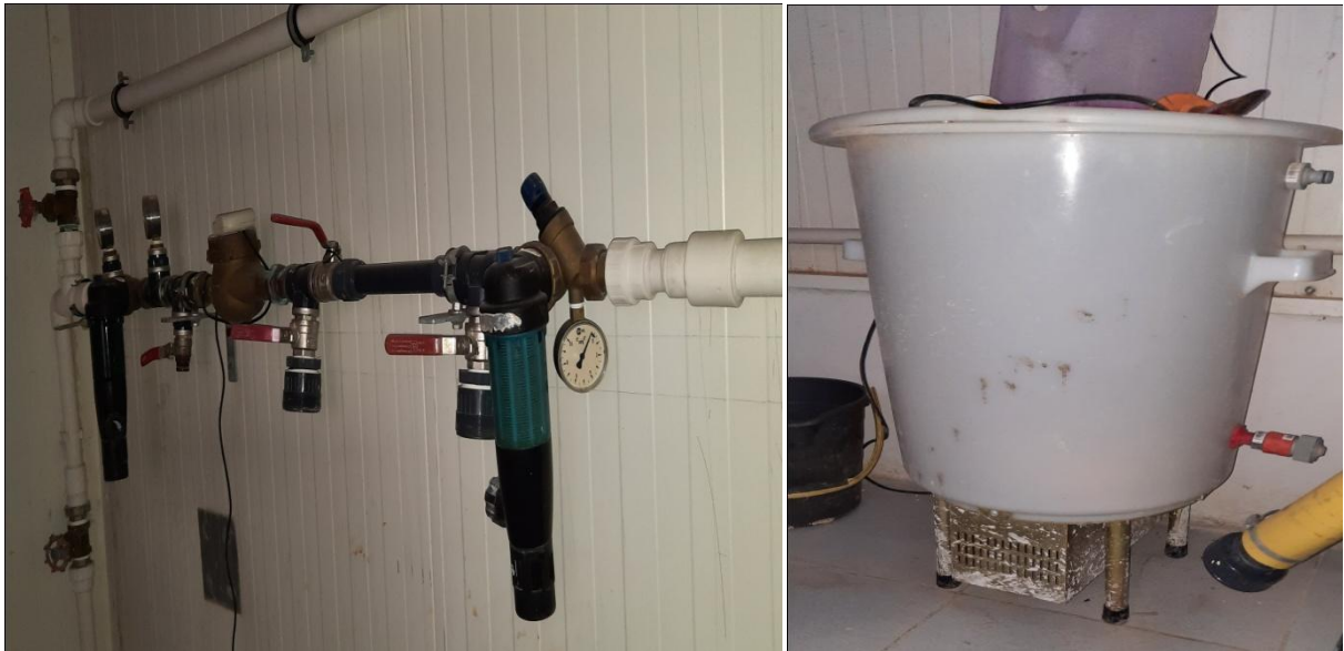
Figure 26 : Jeu de raccordement d'eau (mélangeur de vaccin)