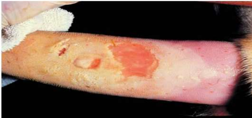
Figure 01 : rupture d'une vésicule aphteuse sur la langue d'une vache. (Dpi, 2019)

La fièvre aphteuse est une maladie virale causé par un virus de la famille des Picornaviridae , genre Aphotivirus. C'est une maladie infectieuse et hautement contagieuse affectant les artiodactyles bi ongulés notamment les bovins, les caprins, les ovins et les porcs. Elle n'affecte pas les chevaux, les chiens ou chats et l'homme est rarement touché. La fièvre aphteuse n'est pas une menace pour la santé publique ou la sécurité alimentaire, mais causer des pertes économiques importantes. (Aphis, 2013)