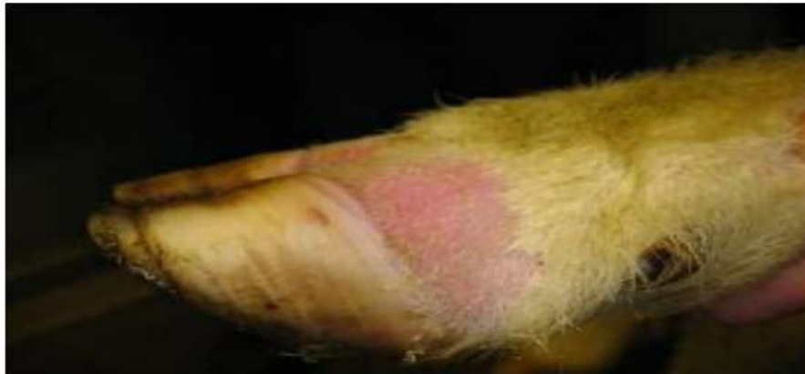
Figure 03 : gonflement de la bande coronaire au sommet des sabots.

La fièvre catarrhale ovine est une maladie virale non contagieuse causé par le virus Orbi virus de la famille des Reoviridae, se compose de 26 sérotypes , elle est vectorielle transmise d'un moucheron de genre Culicoïdes (arbovirose),touche principalement les ovins, elle peut affecter les bovins,les caprins,d'autres ruminants sauvages. La fièvre catarrhale n'affecte pas l'homme et n'a aucune incidence sur la qualité des denrées alimentaires. Le bleu langue est une maladie à déclaration obligatoire. Elle engendre d'importantes pertes économiques pour les éleveurs. (Anses, 2016).