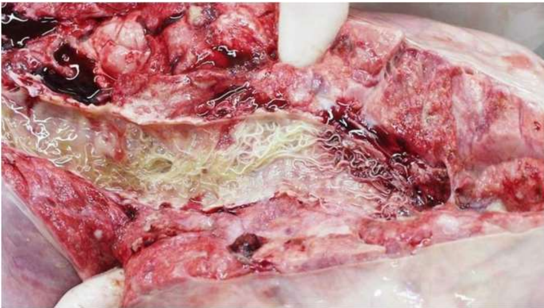
Figure 05 : Vers adultes de dictyocaulus dans une bronche chez les bovins

La dictyocaulose bovine ou bronchite vermineuse est due à l'infestation par Dictyocaulus viviparus , ver parasite des bronches et de la trachée. Cette maladie est communément appelée «la toux d'été», observée chez les bovins adultes surtout dans les régions tempérées à pluviométrie élevée. (Vendée, 2018)