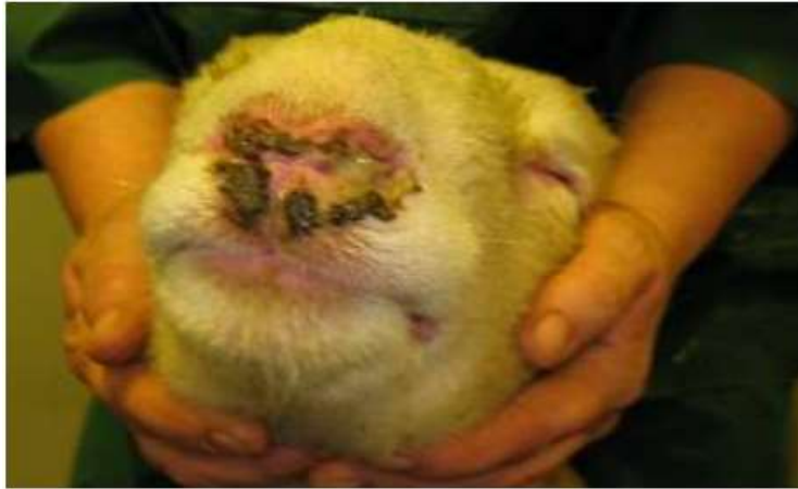
Figure 04 : Oedème facial, écoulement nasal et excoriation de moutons