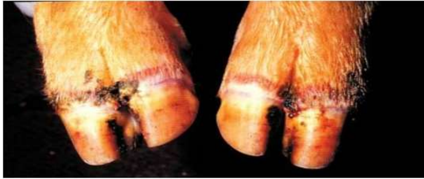
Figure 02 : Lésions typique au niveau de la couronne et les espaces interdigités sur les onglons d'un bovin. (NSW DPI, 2019).